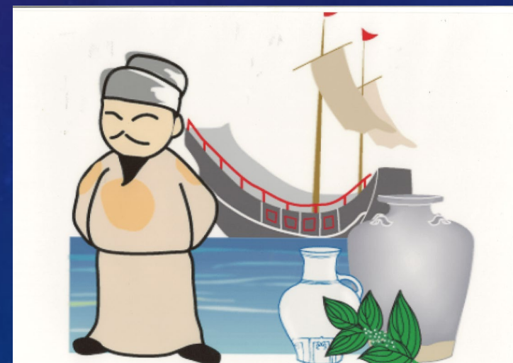
イラスト: 青山奈緒