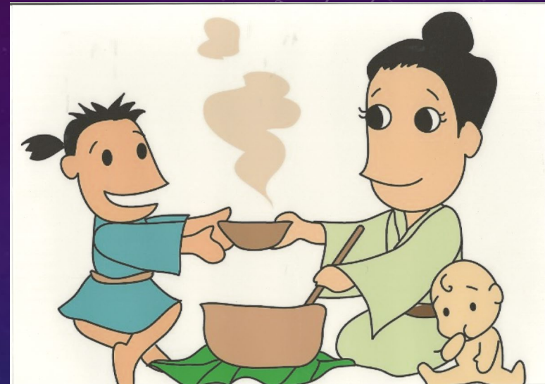
イラスト: 青山奈緒